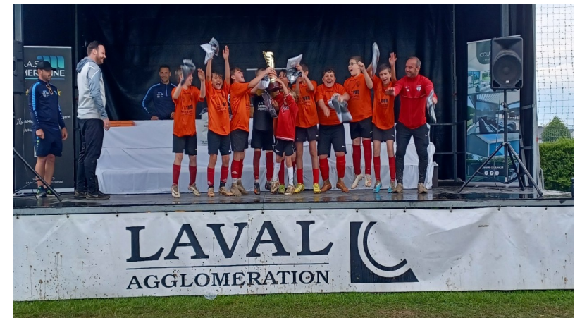
Photo : Lundi de pentecôte victoire au tournoi de BONCHAMPS

Direction la finale de coupe pour les U13 le 15 juin