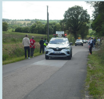
Retour en images sur les boucles de la Mayenne du 26 mai à Bouchamps